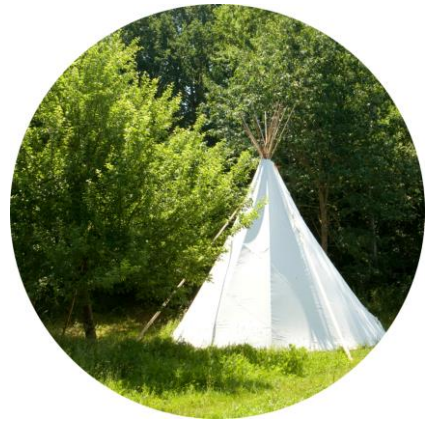
Gartenbauverein mit Tipi